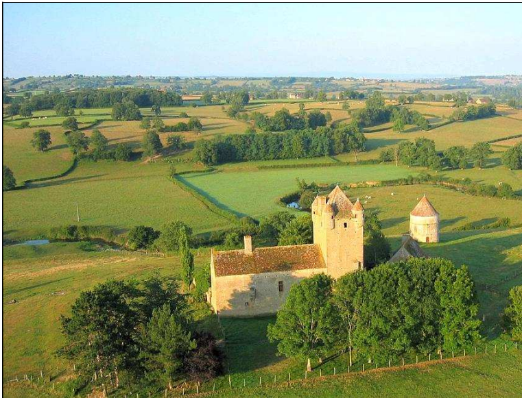
Le site de Montessus se situe sur la commune de Changy, au cœur du bocage charolais.

« Le site de Montessus est un témoignage précieux de l'architecture militaire du Moyen-Âge. Les parties les plus anciennes du donjon datent du XII e siècle, la construction s'est ensuite poursuivie au XIV e siècle. Cette tour de guet sur la colline a été construite pour défendre et protéger